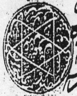
2. Письменное задание: расшифровка, перевод арабского текста рукописи:

دلالة العالم على حركه عقليه به حيث ان لا يقفه كالمقفل يباون خالق ولا يعدوم بخلاف وهو يقفه من حيث ان خلقه واحده كالتقوى دلالة على جوده وودعه ورحمة فان نجا وخالقنا السلام والارضا وما بيننا وبينهم ما خلقناها الا بالحق الاية وليتنا الاية نقاتل كنهية في الثقلان وبعثنا نوحا واسماعيل وصالحا وداودا وسليمانا وعيسى وانا اعلم ما