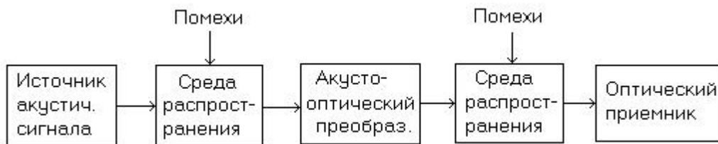
Рисунок 1 - Структурная схема канала утечки информации

1. На рисунке 1 представлена структурная схема