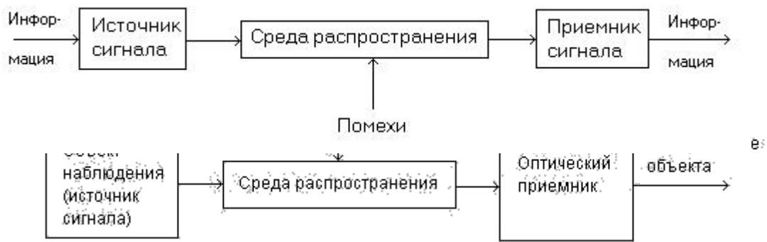
Рисунок 5 - Структурная схема канала утечки

7. На рисунке 5 представлена структурная схема