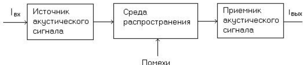
Рисунок 3. Структурная схема канала утечки информации

3. На рисунке 3 представлена структурная схема