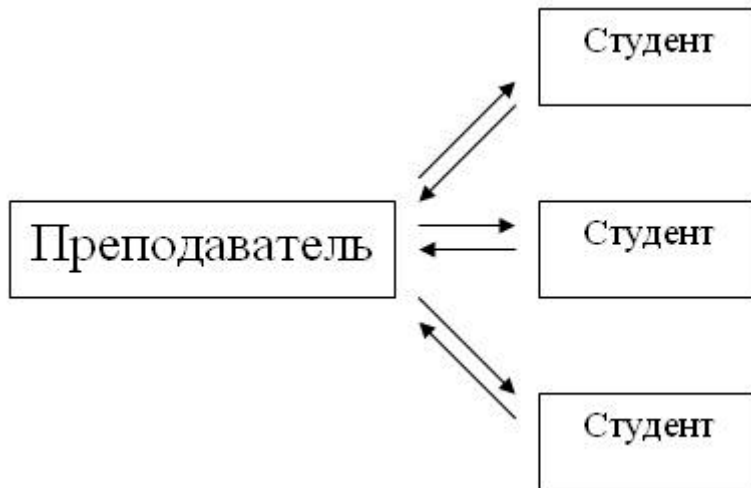
Рисунок 1.2 Активный метод

Активный метод (рис.1.2) – это форма взаимодействия студентов и преподавателя, при которой они взаимодействуют друг с другом в ходе занятия и студенты здесь не пассивные слушатели, а активные участники, студенты и преподаватель находятся на равных правах. Если пассивные методы предполагали авторитарный стиль взаимодействия, то активные больше предполагают демократический стиль.