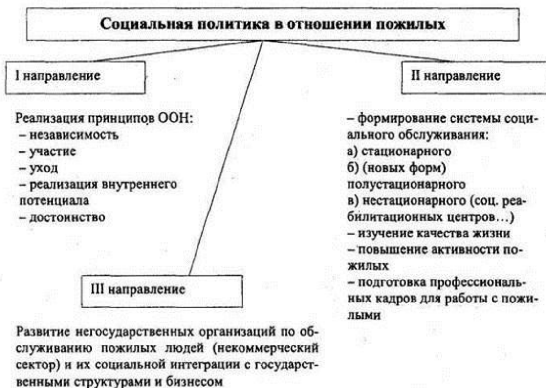
Рис.2. Социальная политика в отношении пожилых людей.