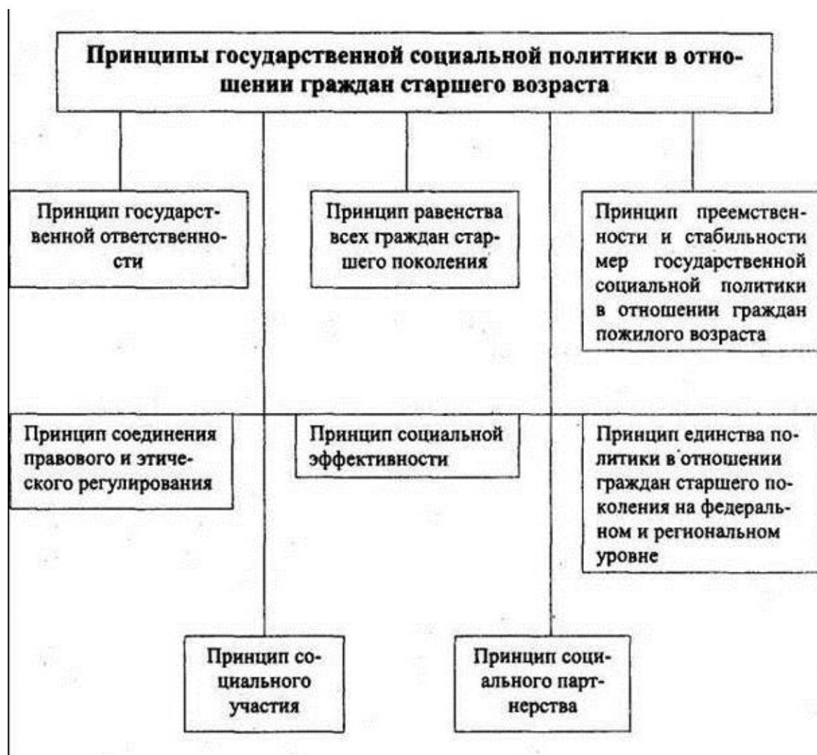
Рис.3. Принципы государственной социальной политики в отношении пожилых людей.